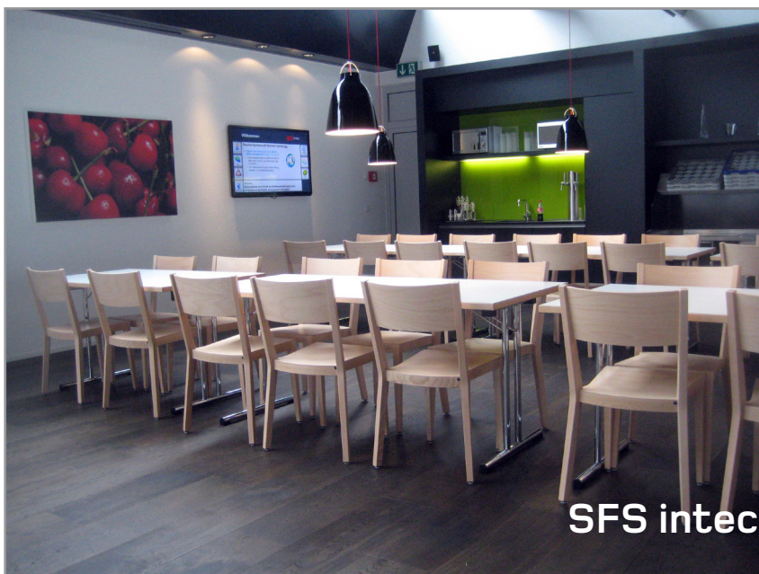
SFS intec Heerbrugg

Mit steigender Individualisierung und Flexibilisierung wird die Arbeitswelt zunehmend zu einer Stimmungs- und Gefühlswelt. Räume zur Regeneration wie Cafeterias, Kantinen, Pausenräume oder Lounges sind zum unverzichtbaren Bestandteil der Unternehmenskultur geworden. Um eine flexible Nutzung dieser Räumlichkeiten zu gewährleisten, finden Sie bei Längle Hagspiel Stapelstühle aus Massivholz und dazu Klapptische oder stapelbare Holztische.