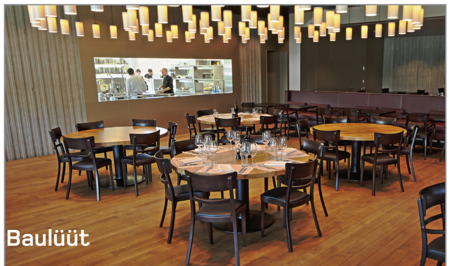
Campus Sursee Baulüt